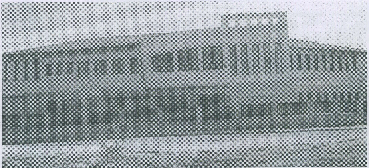
A PÉCELI HARANGVIRÁG ÓVODA ÉPÜLETE