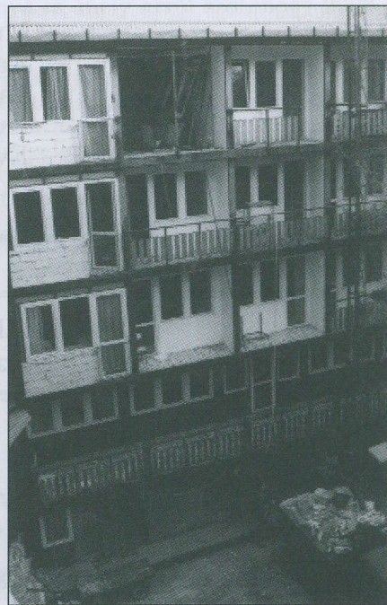
Az Internátus felújítása