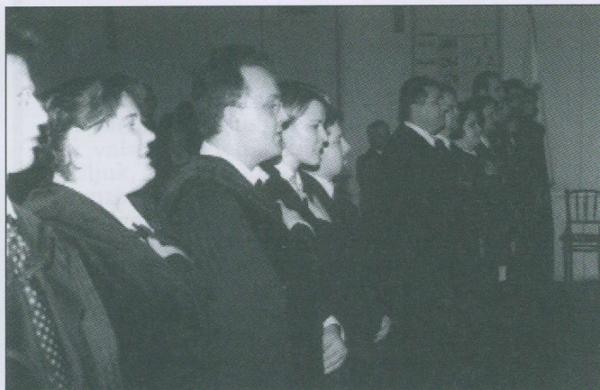
Lelkészek fogadalmötétele a Kálvin téren