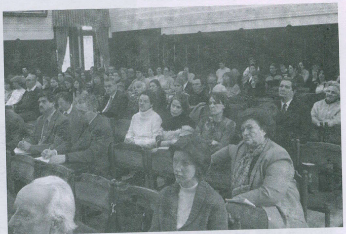
Katechetikai konferencia a felújított díszteremben