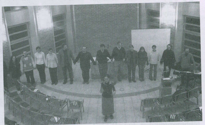
Az egyetemi gyülekezet istentiszteletén