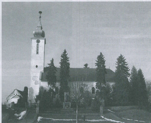
A laskói református templom

Hadd kérdezze most a te Urad: miért sírsz? Elmondhatod neki bátran, úgy, ahogy elmondta Mária is Jézusnak, hogy miért sír, mert kiszakadt belőle a vágy: valaki segítsen már rajtam! Valaki oldja már meg a kérdést! Talán te is azért sírsz, hogy valaki oldja már meg életed kérdését. Végre történjen már valami. Folytatom az ige üzenetét: ennek az igének az evangéli-