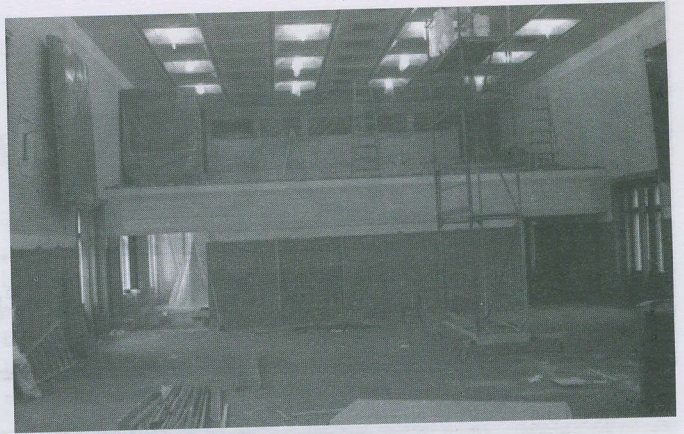
A díszterem felújítás közben