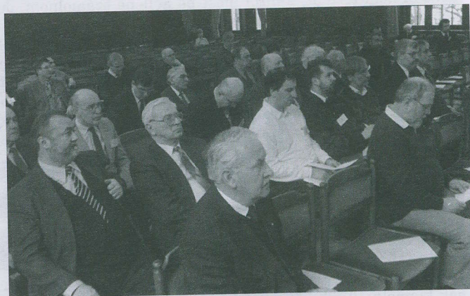
Egyházi tanácsülés a megújult díszteremben

Utoljára pedig szeretném megemlíteni, ebben az esztendőben ünnepli 150 éves fennállását a Budapesti Teológia, ennek nyomán a Károli Gáspár Egyetem. Ősszel lesznek az ünnepség-sorozatok. Azt kérem, hogy hordozzuk imádságban, hogy méltó és szép ünnepség legyen. Azt is hordozzuk imádságban, hogy a Hittudományi Karon a lelkészképzés hatékonyabb legyen, olyan lelkipásztorok kerüljenek ki a Ráday utca 28-ból, akik helyt tudnak állni a gyülekezetekben folyó nem könnyű, és egyre nehezebb munkában. És azt kérem az Egyházkerületi Tanács minden tagjától, hogy amikor a megfelelő tételsorhoz érkezünk, erre a 150 éves jubileumra tekintettel jó szívvvel szavazza meg ennek a költségvonzatait. Főtiszteletű Egyházkerületi Tanács! Nem szeretnék most többet mondani, munkaértekezleten vagyunk, a következő pont a költségvetés megtárgyalása lesz. Kérek mindenkit, hogy mérséklettel, bölcsességgel, a szolidaritás elvét szem előtt tartva tárgyaljuk végig ezeket a pontokat. Köszönöm szépen.