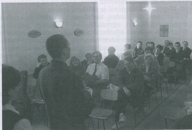
Teológus bizonyágtétele Jászberényben