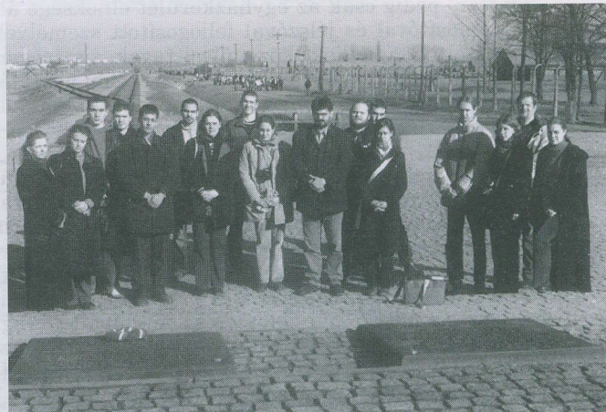
Teológusok az AUSCHWITZ-i emléküton