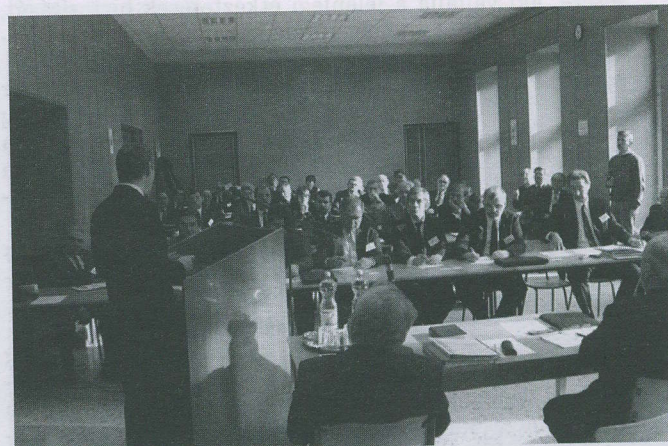
Januári tanácsülés az exhortációs teremben