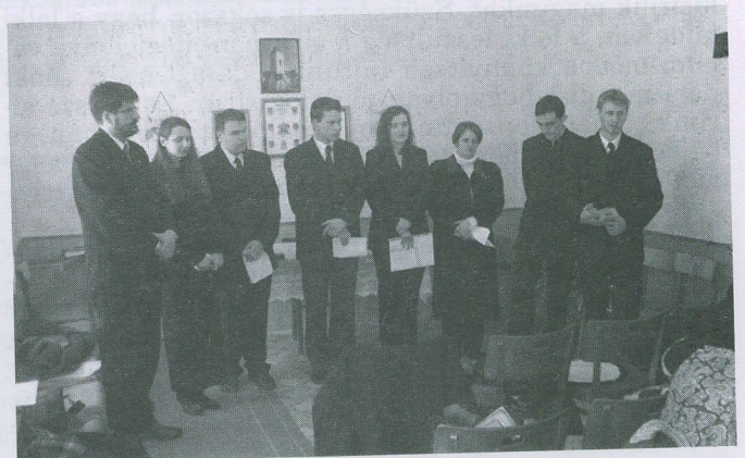
Teológusok szolgálata Hercegszöllősen, 2005 februárjában