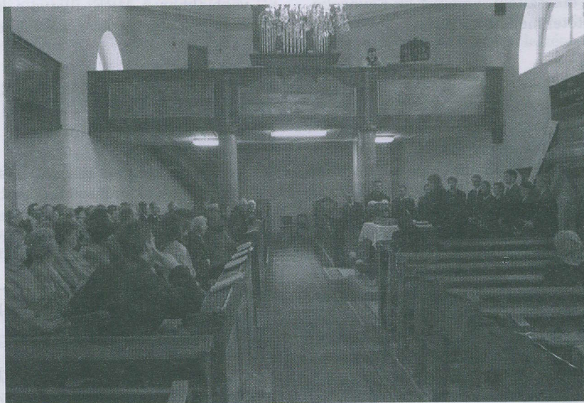
Hallgatók szolgálnak a sárbogárdi teológusnapon

mányt, a határon túli útjainkhoz pedig még némi hozzájárulás is szükséges volt. Ezért is jelenthetem örömmel, hogy lábra állt a teológusok által 1990-ben létrehozott Ágoston Sándor Alapítvány, amely kifejezetten azért jött létre, hogy a teológusok határon túli missziói és egyéb útjait segítse. Ezért kérek mindenkit, ha találkozik ezzel az Alapítvánnyal, és támogatásra méltónak veszi határon túli gyülekezetekért való a szolgálatot, tegye ezt meg anyagilag és imádságban is. Az Ala-