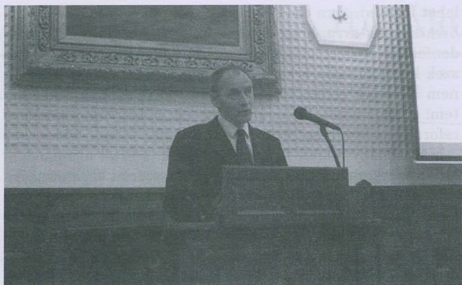
Szabó István püspök értékeli az elmúlt időszakot