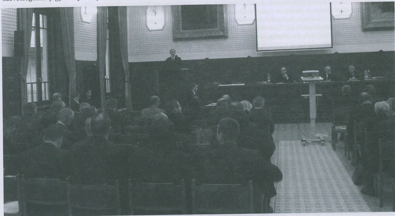
A közgyűlés a felújított díszteremben

Medgyesi Pál azt javasolja Praxis Pietatis-ában, hogy reggelre kelvén is úgy ébredjünk, hogy minden gondolatot, amelyre kelünk, berekesszünk, s csak Isten ígéretére és dicsőségére figyelve kezdjük a napot. „Mindennapi munkának kezdete legyen az Isten ígéje és az imádkozás.... És mi helyt felserkensz, ottan így szólítsd meg a maga szentséges igéjéből Őt: az én lelkem figyelmesebben várja az Urat, mintsem a virrasztó a reggelt”. Ez a mi virrasztásunk mindaddig tart, míg Krisztus dicsőséges országában megérkezik. Boldog az a szolga, akit az ő Ura úgy talál, hogy bolondul töltött idejét már bűnbánattal megváltotta, minden jelenvalóban állhatatosan járt el, s a jövődőt önmaga megtartóztatásában ügyelte. Akkor nem kell félnünk semmilyen ellenségtől, mert akkor Istenünk kezében vagyunk, akkor hihetjük, hogy nem vett rajtunk uralmat a bűn, hanem az Ő kegyelme és Szentlelke ereje lakozik bennünk.