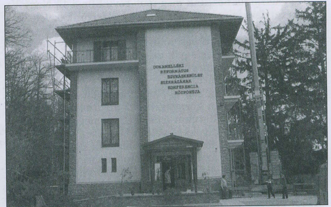
A felújított mátraházi konferenciaközpont