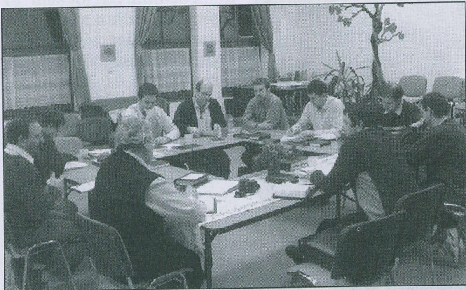
Ülésezik az Ifjúsági Bizottság