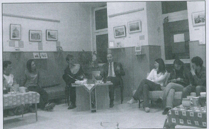
Teológusok találkozója a püspökkel