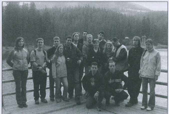
Teológusok a Szinevéri tónál

Összesen tehát 20 teológusnap volt az egész évben, két alapítványi kiszállás és két gimnáziumi megmozdulás. Két tanulmányi utat szerveztünk, az elsőt a református vidékekre: Szerencs-Gönc-Vizsoly, a másodikban Isten kegyelméből eljuthattunk a Szentföldre, az egyházkerület és az egyetem támogatásával, ami meghatározó élménye lett minden diáknak.