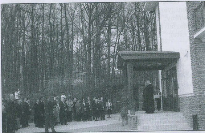
Az üdüdő átadásának ünnepe