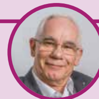
Balog Zoltán református püspök

Legyen áldás rajtunk ezeken a napokon és illesse köszönet a házigazdákat, és az Északpesti és Vértesaljai Egyházmegyéket vendégszeretetükért!