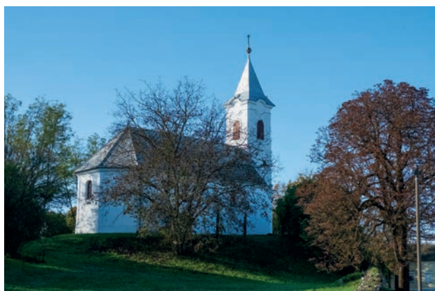
A terehegyi református templom

https://www.termeszettjaro.hu/hu/tour/kerekpartura/sztarai-kerekpartura/803977695/